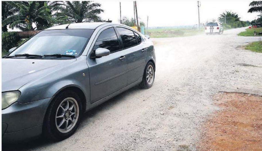
Penduduk resah jalan kampung mereka berdebu selepas kerja-kerja menaik taraf laluan itu.

naik taraf jalan sepanjang kira-kira 1 kilometer itu bukan saja mengundang pencemaran udara tetapi menjejaskan kesihatan.