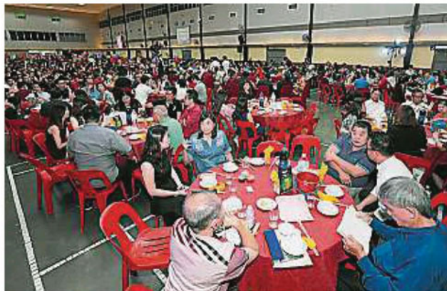
▲汉民华小举办筹募发展建设基金晚宴，以筹募提升学校软体设备及其他经费。