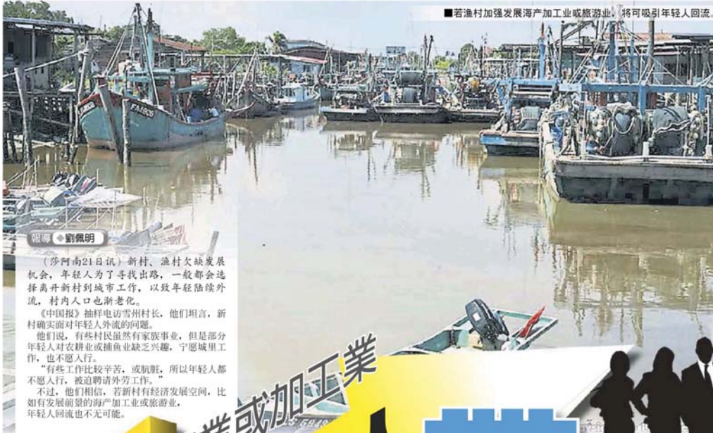
■若漁村加強發展海產加工業或旅遊業，將可吸引年輕人回流。

Provided for client's internal research purposes only. May not be further copied, distributed, sold or published in any form without the prior consent of the copyright owner.