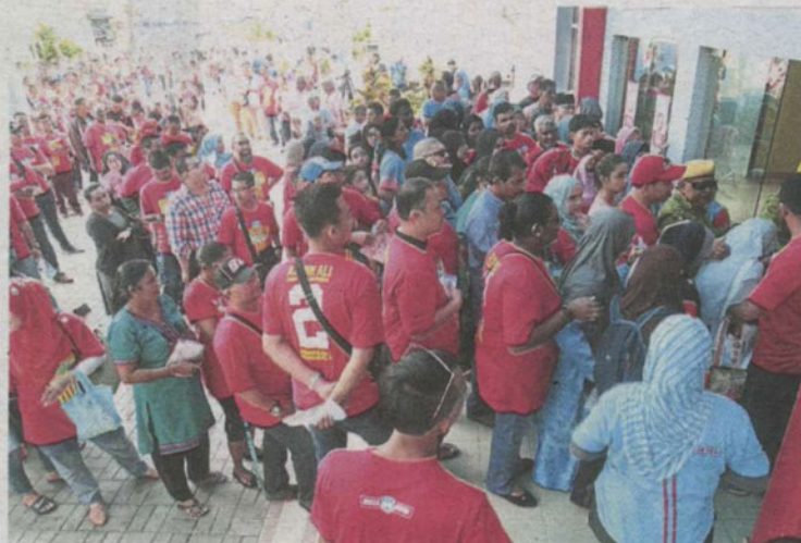
Doing their duty: PKR members lining up to cast their votes at Dewan Sri Siantan in Batu Caves.

"Actually, once they are inside the fencing