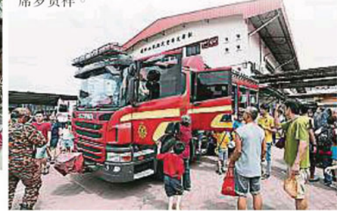
▶除了各式各样的摊位外，学生们也把捉机会，一尝坐上消防车的滋味。