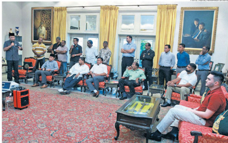
Tengku Amir Shah bertemu wakil kelab gabungan sewaktu sesi Townhall baru-baru ini.

"Surat itu dikeluarkan sendiri oleh setiausaha saya kerana pada asalnya kami diberitahu surat itu untuk menyokong Raja Muda Selangor (RMS), Tengku Amir Shah sebagai presiden. Tetapi bila dipanggil ke istana saya terkejut melihat surat ini ditukar kononnya kami setuju untuk tukar segala-galanya.