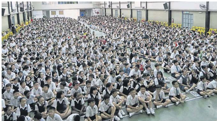
蒲种过去 20 年来人口大幅增长，华裔学生增加，现有的华小将不足以应付未来需求。(档案照)