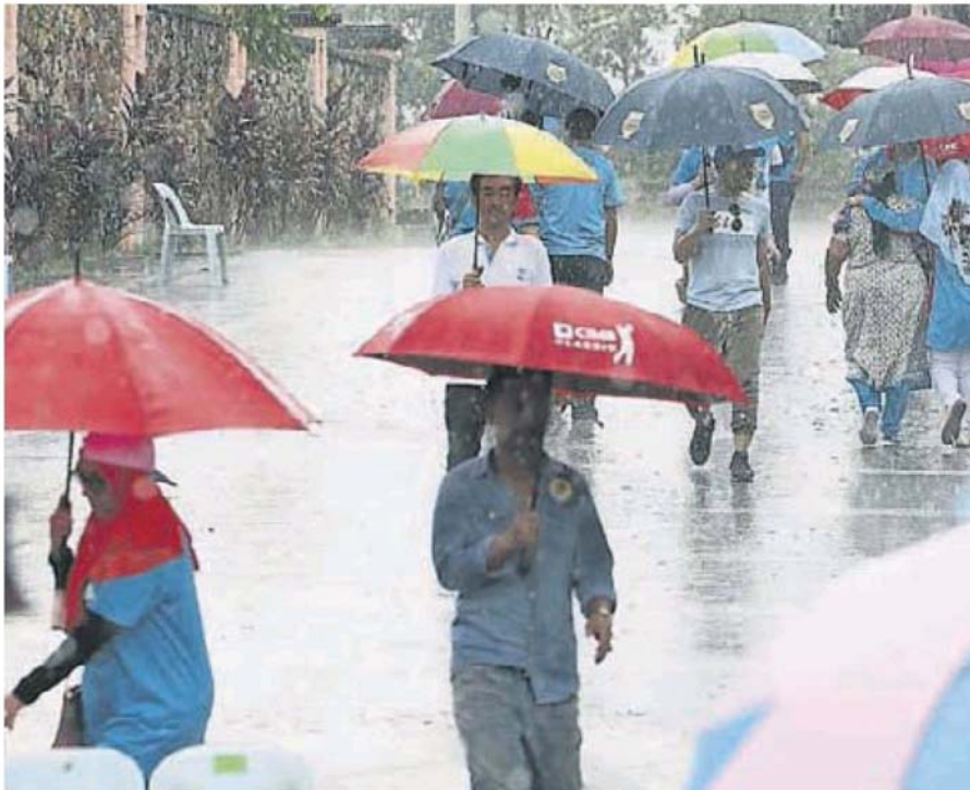
■天不作美下大雨，党员撑伞进入投票中心。