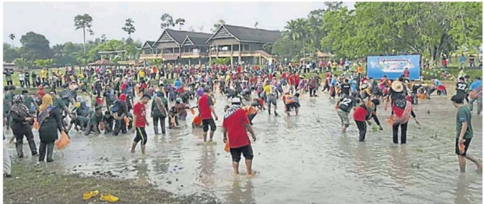
抓鱼活动不但让大家寻找乐趣，同时也可展现团队的分工合作精神。

他希望居民代表委员会每年都会举办类似大型活动，以此拉近各区居民之间的联系，同时也促请居民与地方政府、州政府及市议员等亲善关系。