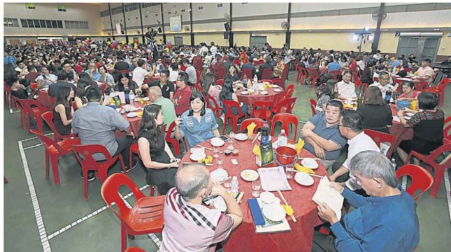
汉民华小举办筹募发展建设基金晚宴，筹募改善学校软体设备及其他经费。