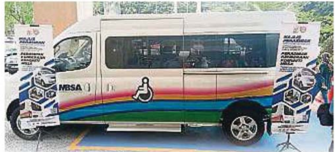
▲沙亚南市政厅为当地残疾人士送上贴心的载送服务，好让他们准时到达医院看病或复诊。