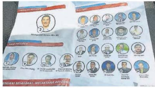
■阿兹敏阿里派系菜单印上团队竞选编号。