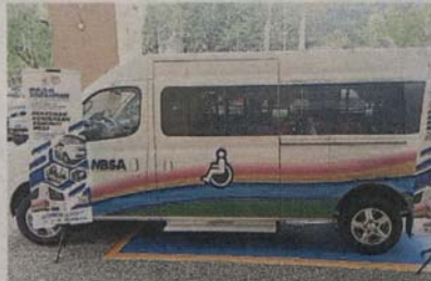
■沙亚南市政厅为当地残疾人士送上贴心载送服务，让他们准时到达医院看病或复诊。