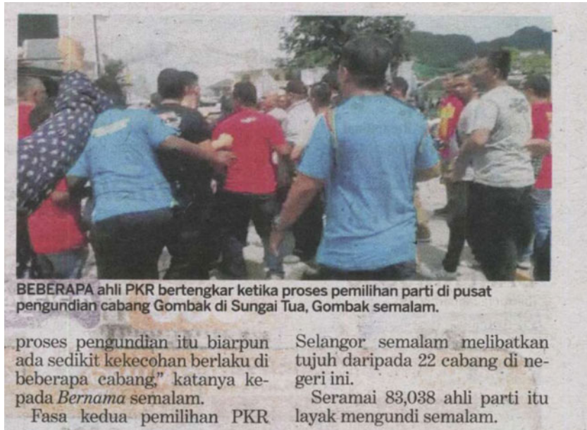
BEBERAPA ahli PKR bertengkar ketika proses pemilihan parti di pusat pengundian cabang Gombak di Sungai Tua, Gombak semalam.

proses pengundian itu biarpun ada sedikit kekecohan berlaku di beberapa cabang," katanya kepada Bernama semalam.