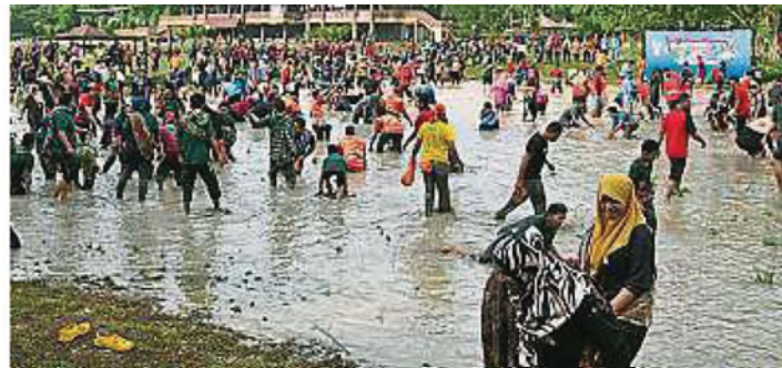
▲ 参与的沙亚南市政厅居委会队员卯足全力，赤脚冲下烂泥地，用塑料袋来个捞鱼乐。