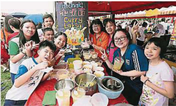
▲教师、家长及学生分工合作，一同经营义卖会摊位。